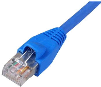
Conexión Cable de Red RJ45